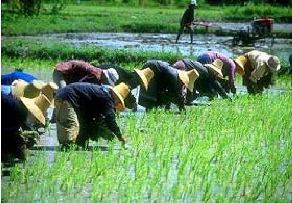
ภาพที่ 1 วิถีชีวิตคนไทยผูกพันกับการนาปลูกข้าวสืบทอดกันมาอย่างยาวนาน

ข้าวมีความสำคัญและเป็นส่วนหนึ่งของสังคมเศรษฐกิจมาอย่างช้านาน ดังเช่น บันทึกหลักฐานการค้าไทยจีนในปี พ.ศ. 2265 จากที่กษัตริย์คังซี 1 ได้ทรงสดับจากทูตที่ไปจากสยามว่า “ในแผ่นดินสยามข้าวอุดมสมบูรณ์ ราคาถูกลงมาก เงินหนึ่งเหรียญซื้อข้าวได้ร้อยทะนาน” 2 และเพื่อที่จะแก้ปัญหาความขาดแคลนข้าวของมณฑลกว้างต้งและฮกเกี้ยน จีนจึงได้ประกาศและสนับสนุนให้ไปซื้อข้าวจากสยาม 3