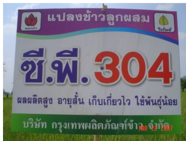
รูปที่ 4 แผ่นป้ายโฆษณาข้าวลูกผสมพันธุ์ CP 304

ข้าวลูกผสม ถือว่าเป็นพันธุ์พืชอีกชนิดที่เจริญโภคภัณฑ์เมล็ดพันธุ์ให้ความสนใจ โดยอาศัยงานทดลองจากจีนเป็นต้นแบบ โดยความร่วมมือของนักวิชาการจากจีน และสถาบันวิจัยชาวนานาชาติ ฟิลิปปินส์ สำหรับตลาดเมล็ดพันธุ์ข้าวลูกผสม กลุ่มธุรกิจพืชครบวงจร ได้ตั้งเป้าหมายที่จะก้าวไปสู่การเป็นผู้นำตลาดเมล็ดพันธุ์ข้าวลูกผสมอย่างครบวงจรในระดับสากล โดยได้เริ่มโครงการข้าวครบวงจรขึ้นในปี พ.ศ. 2537 โดยดำเนินการวิจัย ณ ฟาร์มกำแพงเพชร จ.กำแพงเพชร