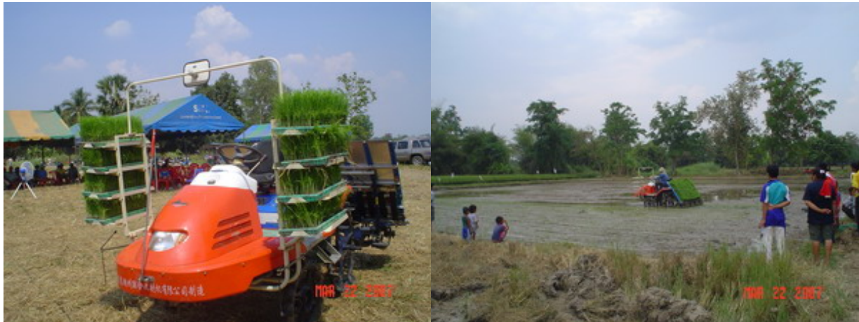
รูปที่ 4-5 ซีพี บริการพันธุ์ข้าวพร้อมปักดำให้ชาวนา ราคา 1,600 บาทต่อไร่

ซีพีส่งเสริมการขายข้าวลูกผสมโดยจัดทำโครงการ "ศูนย์ถ่ายทอดเทคโนโลยีการเกษตร ซีพี" ขึ้นเพื่อนำร่องการส่งเสริมข้าวลูกผสม โดยมีแผนจัดสร้างศูนย์ดังกล่าวจำนวน 15 แห่งในปี พ.ศ. 2551 ครอบคลุมพื้นที่ภาคเหนือและภาคกลาง ได้แก่ ชัยนาท นครสวรรค์ พิษณุโลก แพร่ เชียงใหม่ เชียงราย ลำพูน พะเยา นครราชสีมา พิจิตร ฯลฯ