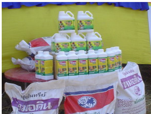
รูปที่ 6 ปุ๋ยอินทรีย์และสารกำจัดศัตรูพืช ภายใต้เครื่องหมายการค้าต่างๆ ของซีพี

จากการศึกษาภาคสนามพบว่า ซีพีดำเนินการส่งเสริมข้าวลูกผสม โดยจัดทำนิทรรศการเพื่อเชิญชวนชาวนาให้เข้าร่วมโครงการในงานต่างๆ ของจังหวัด รวมถึงในระดับหมู่บ้าน ชาวบ้านที่สนใจจะถูกส่งไปสัมมนา และเมื่อตัดสินใจเข้าร่วมโครงการ ก็จะมีทีมงานเข้าไปแนะนำเทคนิคการทำนาเป็นระยะๆ ซีพีแนะนำให้ชาวนาปลูกข้าวแบบปักดำ และใช้บริการรถปักดำของบริษัท โดยคิดค่าบริการรวมค่าพันธุ์ข้าวและค่าเครื่องจักรปักดำ 1,600 บาท/ไร่ แต่หากจะปลูกแบบหว่านก็ได้ โดยบริษัทจะขายเมล็ดพันธุ์ให้ในระดับราคากิโลกรัมละ 150 บาท พร้อมทั้งขายผลิตภัณฑ์อื่นๆ ควบคู่ไปด้วย เช่น การใช้ปุ๋ยอินทรีย์น้ำ "วีโก้" และสารกำจัดศัตรูพืช "วูการ์" ในการกำจัดโรค เป็นต้น